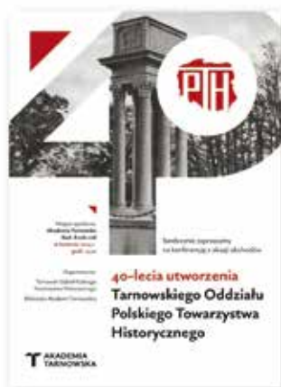
40-lecie powstania Polskiego Towarzystwa Historycznego w Tarnowie