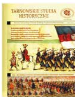
„Tarnowskie Studia Historyczne” periodyk naukowy TO PTH