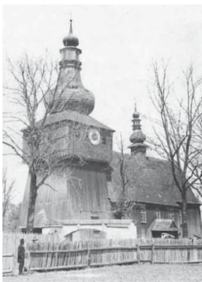
Kościół w Lubniu przed 1945 r.