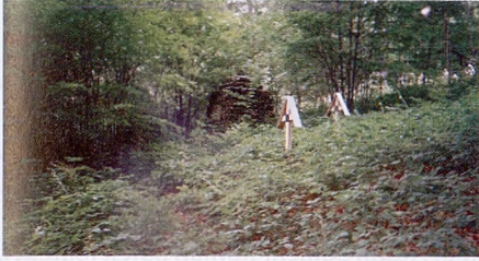
Pustki – kwatera pułku wadowickiego.