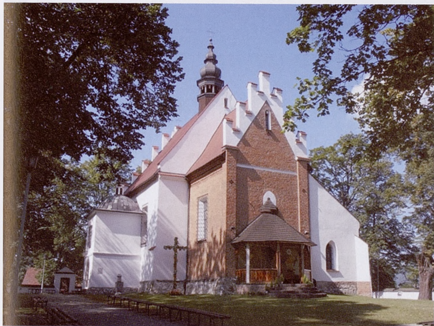
Ryc. 1. Kościół w Rudawie